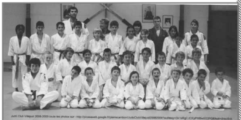
Judo Club Villejust 2008-2009 Inside les photos sur : http://picsasweb.google.fr/jamescambr/JudoClubVillejust20082009?authkey=CkYtRgCj3YFWBw5C3FQdMw8drac1a

La section judo de Villejust montre un grand dynamisme, la rentrée sera prometteuse avec des adhérents dès l'âge de 6 ans et 4 judokas classés 1er, 2ème et 3èmes de l'Essonne.