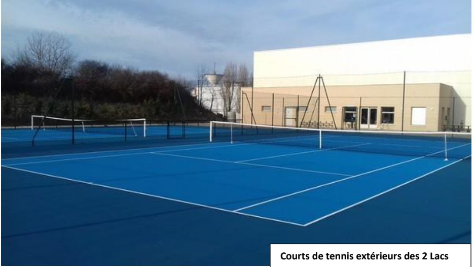
Courts de tennis extérieurs des 2 Lacs