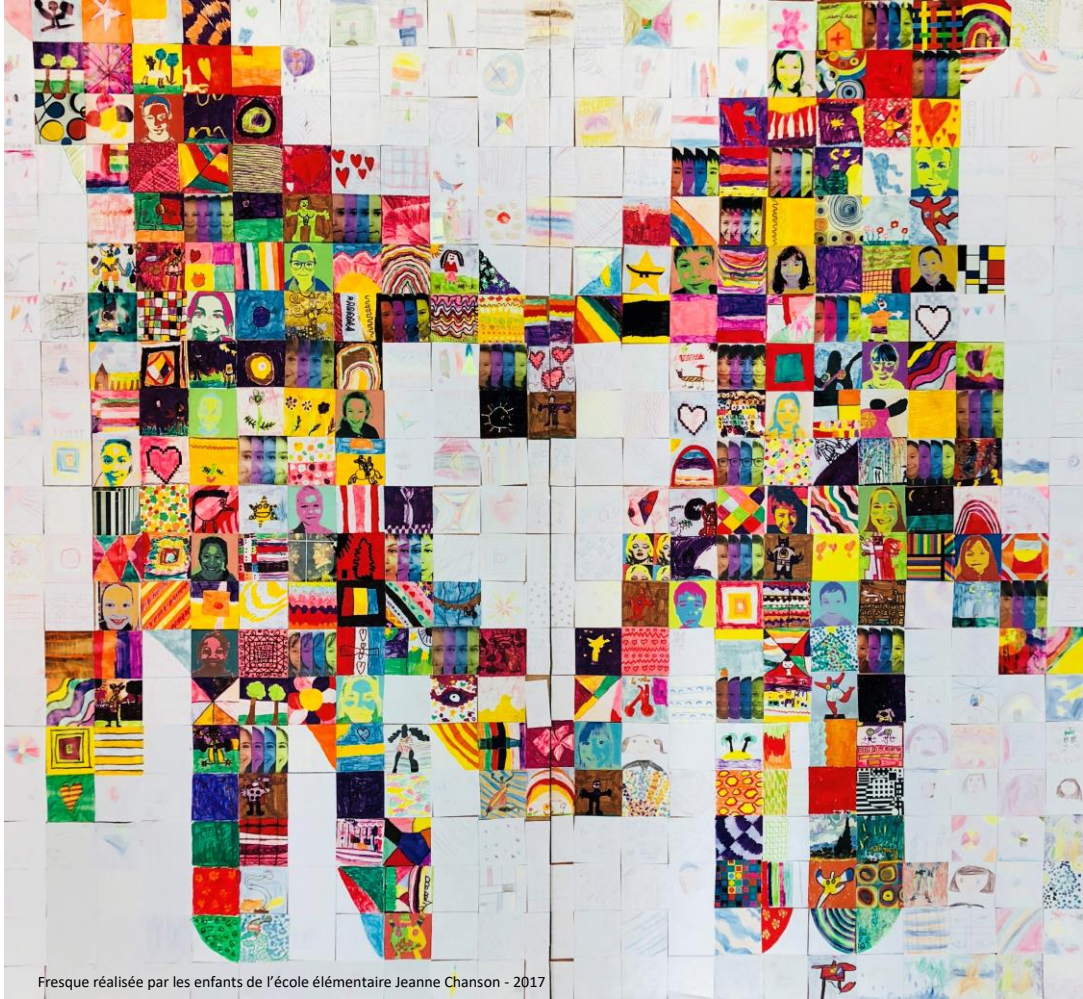
Fresque réalisée par les enfants de l'école élémentaire Jeanne Chanson - 2017