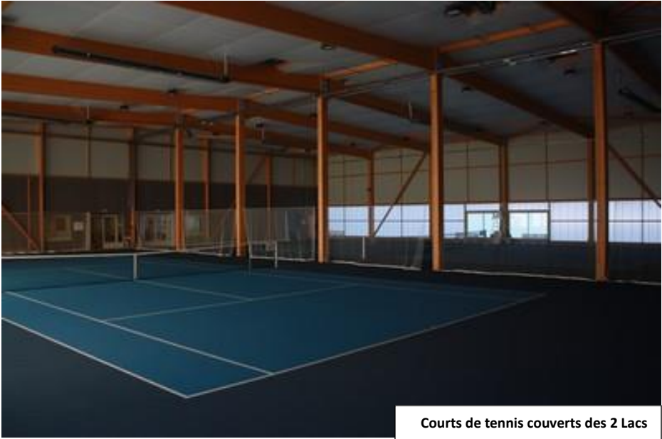
Courts de tennis couverts des 2 Lacs